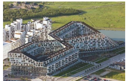
8-House/8 Tallet Ørestad