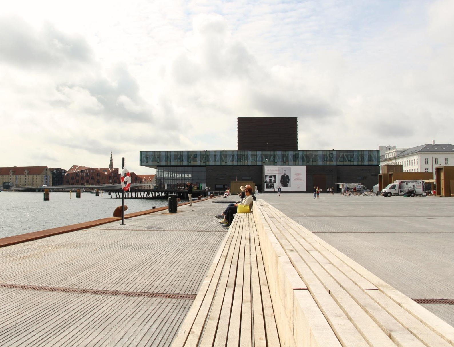
The Royal Danish Playhouse (2008), Lundgaard & Tranberg