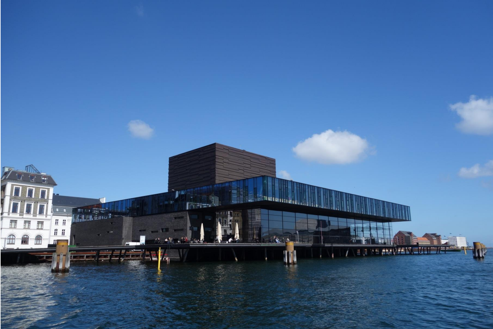
Royal Danish Playhouse