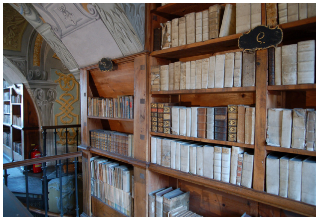
Restaurierung Stiftsbibliothek