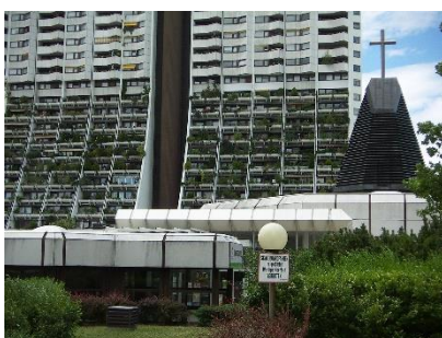
Wohnpark Alt Erlaa, Kirche außen