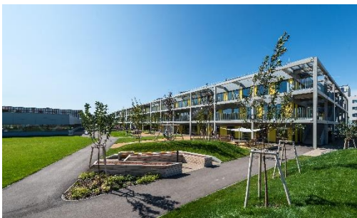
Bildungscampus Friedrich Fexer, Attemsgasse